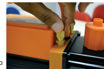
Válvula de Gás Ballast

A Válvula de Gás Ballast introduz uma quantidade controlada de ar seco nas câmaras da bomba durante a compressão para minimizar este efeito e manter o óleo limpo.