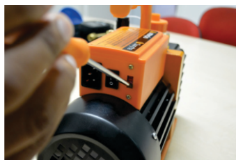
6 - Selecione a tensão correta 110v ou 220v;

7 - Através do Nípel de Sucção, conecte mangueira de serviço do seu Manifold 1/4" ou mangueira exclusiva 3/8" para executar o vácuo em seu sistema;