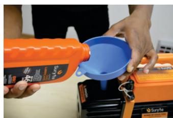
2 - Complete o óleo do cárter conforme capacidade especificada na tabela de Dados Técnicos, verificando pelo visor do nível. UTILIZE ÓLEO ISO VG46 SURYHA (80156.001)