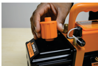
1 - Retire a tampa de insuflamento de ar do Carter de óleo;