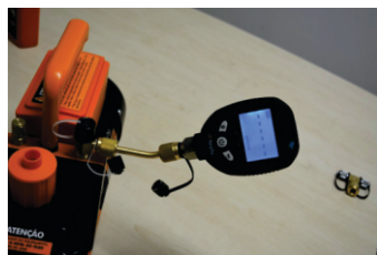
5 - A SURYHA recomenda a utilização de VACUÔMETRO DIGITAL (80150.065) , garantindo precisão no resultado