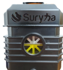
3 - Analise se o nível do óleo está entre a indicação mínima e máxima, localizada no meio do visor.